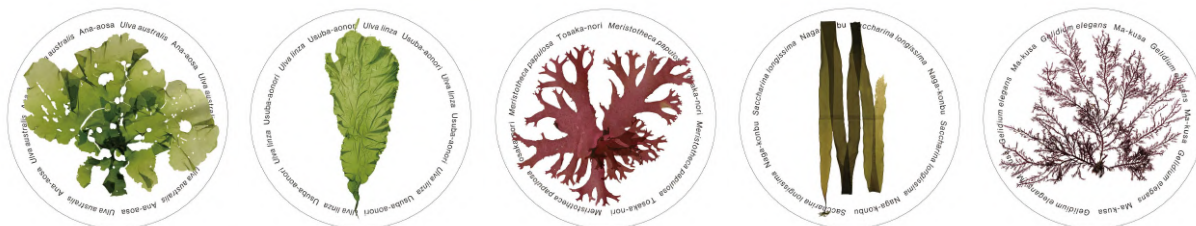
海藻コースター 各968円 (税込)