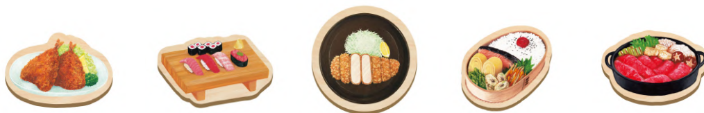
マグネット 660円 (税込)