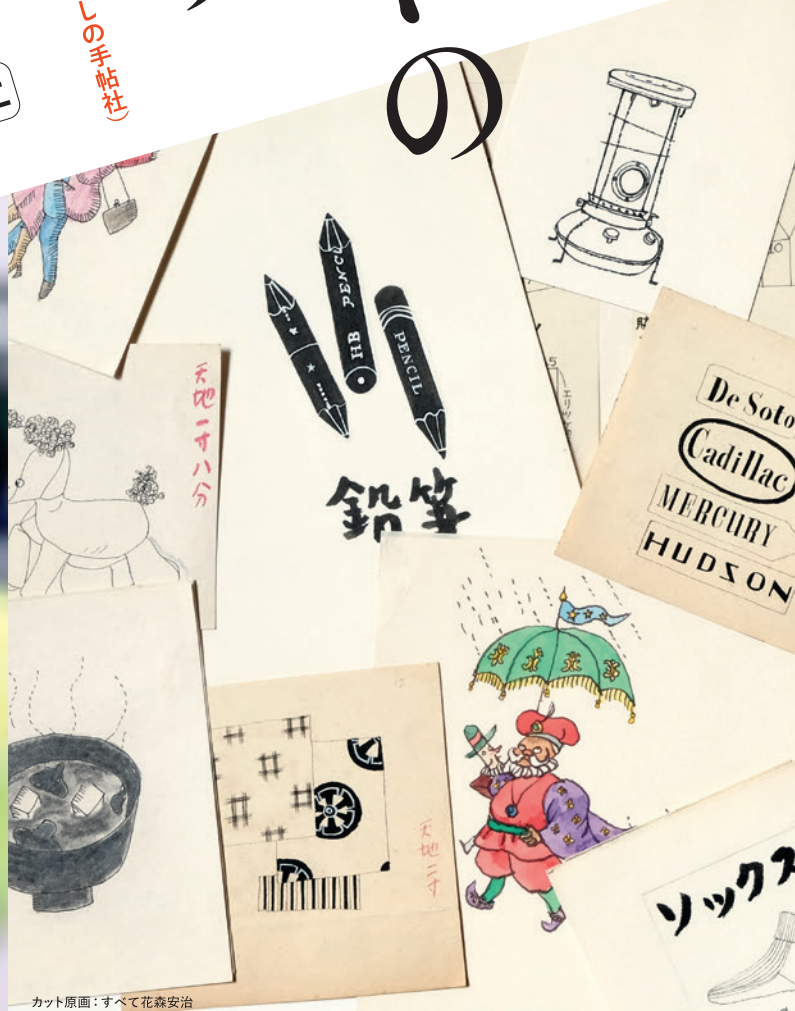
カット原画：すべて花森安治