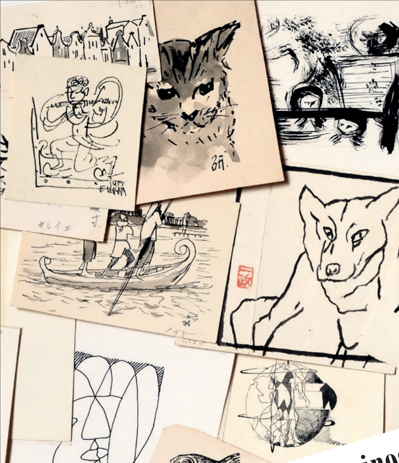
カット原画：右上より時計回りに、駒井哲郎、中川一政、宇佐美圭司、木村狂八、飯田善徳、長次郎、海老原喜之助、荻須高徳、中村研 © Ari Komai 2023 / JAA2300092