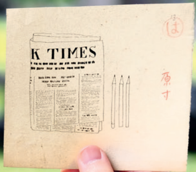
カット原画：花森安治

〒157-0075 東京都世田谷区砧公園1-2 Tel. 03-3415-6011 (代表) https://www.setagayaartmuseum.or.jp/ 展覧会のご案内: 050-5541-8600 (ハローダイヤル)